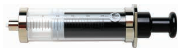
P/N#009463、25mL、固定ルアーロックタイプ ガスタイト(PTFEチッププランジャー)シリンジ