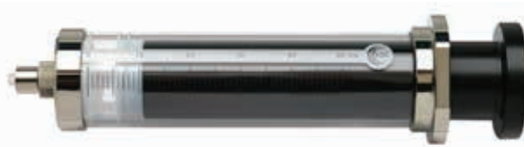
P/N#009660、50mL、交換ルアーロックタイプ ガスタイト(PTFEチッププランジャー)シリンジ