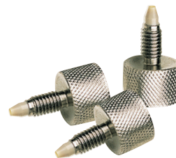
P/N : 206102