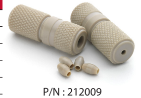
P/N : 212009