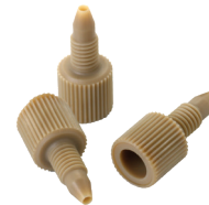
P/N : 20627520