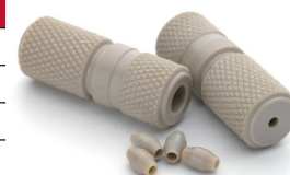
P/N : 212009