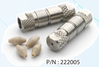
P/N : 222005