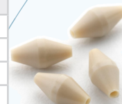
P/N : 223005