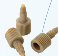
P/N : 20627520